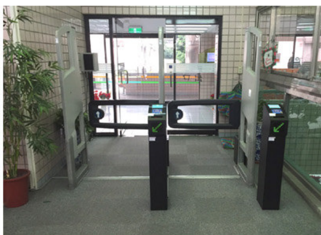
致理科技大學圖書館