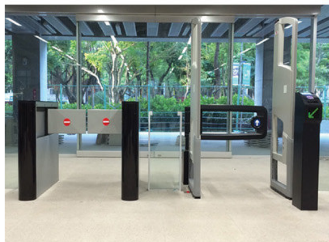
國立臺灣大學法社學院辜振甫圖書分館